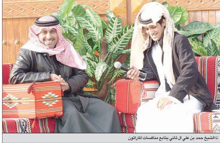
الشيخ حمد بن علي آل ثاني يتابع منافسات الماراثون

ويعد الاتحاد القطري للفروسية إلى وضع مخطط كبير في المرحلة القادمة بدأ بالفعل، وهو الاهتمام بالقاعدة التي تعد أساس أي رياضة، فبعد النتائج المشرفة لقطر في دورة الألعاب الآسيوية والتي تحققت نتائج جده ودراسة وتنفيذ برنامج محددة من معسكرات خارجية واهتمام باللعبه بنوي الاتحاد خوض أي منافسة خارجية قادمة من منطلق قوة في المشاركة لتحقيق الفوز وهو ما يسعى إليه الاتحاد بجانب العناصر الأخرى لتطوير اللعبة